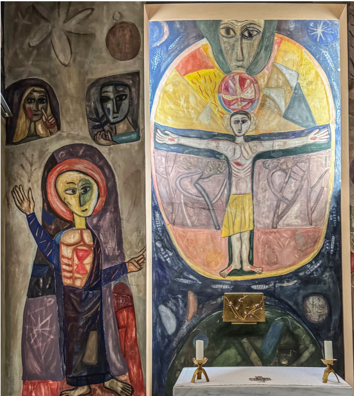
(8) A.v. Malizew, Menologion der orthodox-katholischen Kirch des Morgenlandes Berlin 190